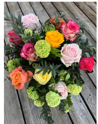
bunte Rosen aus Österreich mit passenden Beiwerk