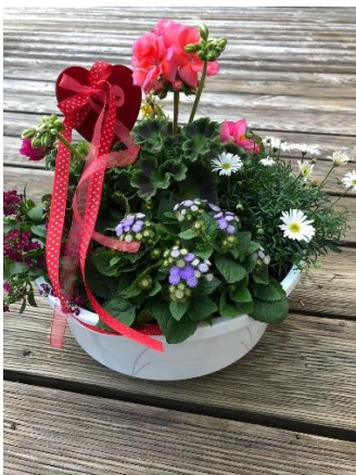
bunte Sommerblumen mit Herz