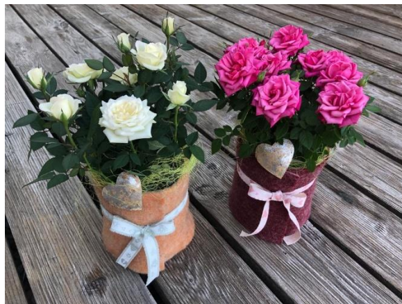
Österreichische Rosen im Glaswindlicht mit Filz